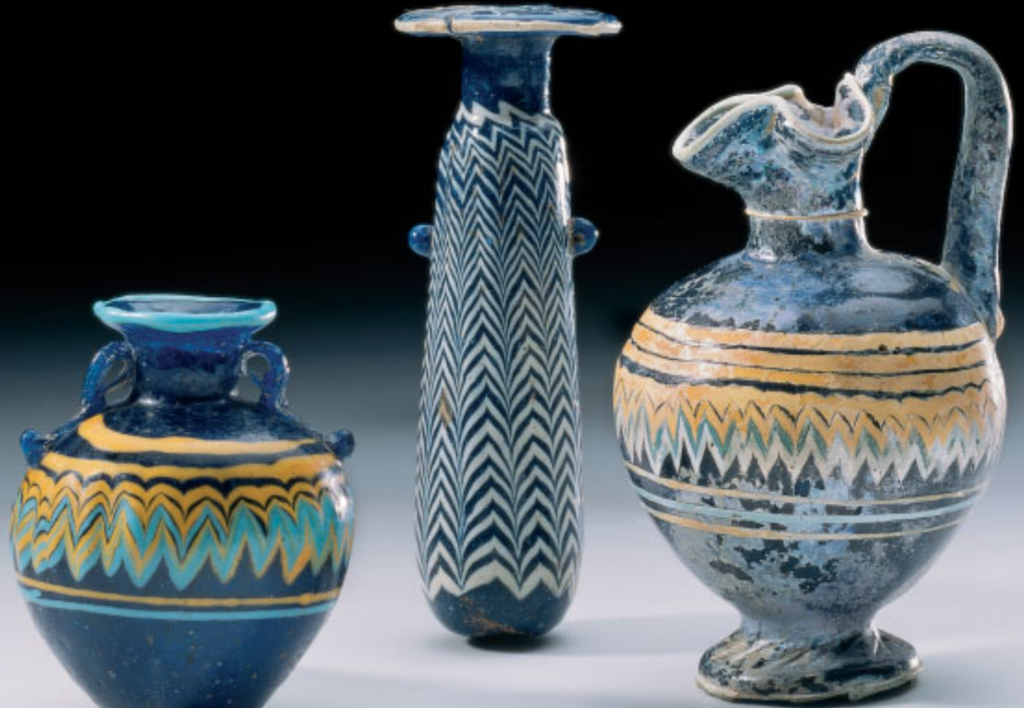
Kerngeformte Gefäße aus dem ostmediterranen Bereich zur Aufbewahrung von Ölen und Parfums (6. bis 4. Jh. v. Chr.).

Im 14. Jh. v. Chr. begannen mykenische Handwerker damit, importiertes Rohglas im ägäischen Bereich zu verarbeiten. Der Fernhandel über das Meer hatte bereits in dieser Zeit eine große Bedeutung für die Verbreitung sowohl von Glasprodukten als auch von Rohglas, wie Funde von Schiffswracks belegen, so z.B. das im 14. Jh. v. Chr. bei Uluburun vor der türkischen Küste gesunkene Segelschiff (AiD 1/06, 14 ff.).