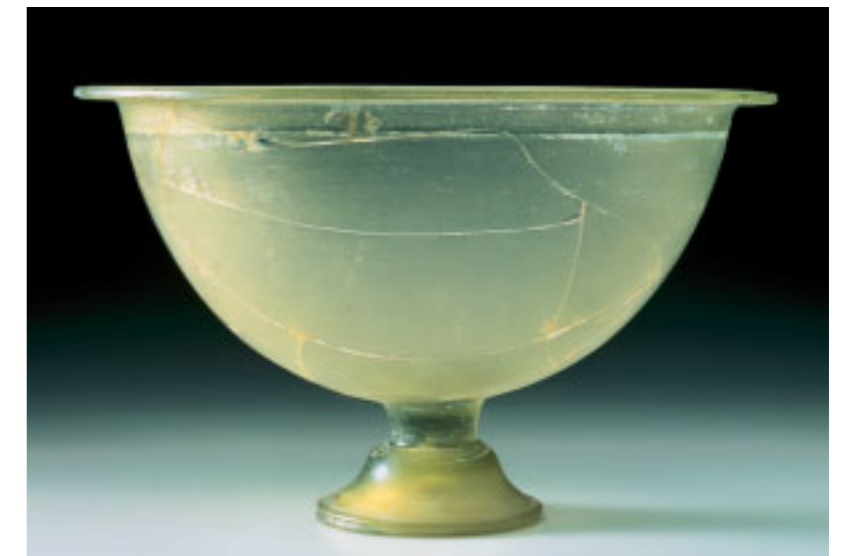
Die Technik des Absenkens ließ ab der hellenistischen Zeit auch die Herstellung größerer Glasgefäße zu, wie am Beispiel dieser halbkugeligen Schale zu erkennen ist. Sie stammt vermutlich aus einer Nekropole in Canosa/Italien (2./1. Jh. v. Chr.).