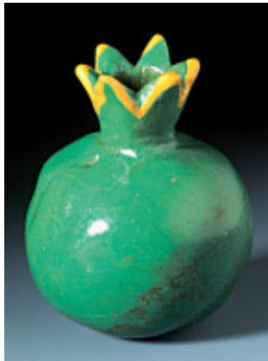
Der Granatapfel galt in der Antike als Symbol der Fruchtbarkeit. Vermutlich wurden ägyptische Granatapfelgefäße wie dieses, mit duftenden Essenzen gefüllt, Frauen als Geschenk dargebracht (18. oder 19. Dynastie, 14./13. Jh. v. Chr.).

Der römische Schriftsteller Plinius d.Ä. überliefert in seiner Naturgeschichte die Sage von der Entdeckung der Glasherstellung: Eines Tages landete ein Schiff mit Natronhändlern an der phönizischen Küste. Um ihren Kesseln auf den Feuerstellen Halt zu geben, griffen diese in Ermangelung von Steinen auf Natronbrocken zurück. Als diese sich erhitzten und dabei mit dem Sand vermischten, entstand ein Rinnsal aus einer bisher unbekanntem, durchsichtigen Flüssigkeit: Glas. Jenseits der Welt der Sage benötigt man freilich weitaus höhere Temperaturen für das Schmelzen der Grundbestandteile von Glas, als ein einfaches offenes Feuer je erreichen könnte. Trotzdem trägt die von Plinius überlieferte Geschichte doch ein Fünk-