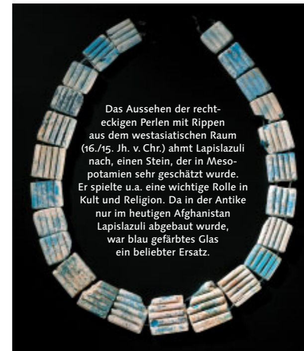
Das Aussehen der rechteckigen Perlen mit Rippen aus dem westasiatischen Raum (16./15. Jh. v. Chr.) ahmt Lapislazuli nach, einen Stein, der in Mesopotamien sehr geschätzt wurde. Er spielte u.a. eine wichtige Rolle in Kult und Religion. Da in der Antike nur im heutigen Afghanistan Lapislazuli abgebaut wurde, war blau gefärbtes Glas ein beliebter Ersatz.