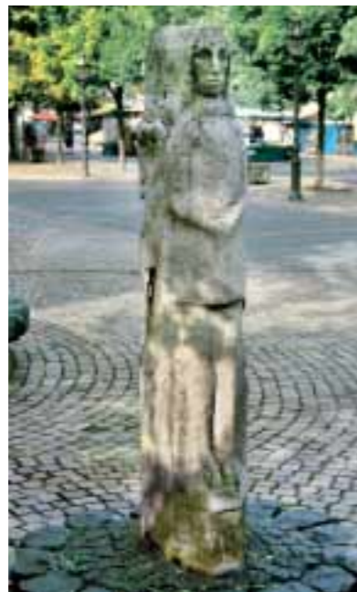
Der Pranger der Stadt Siegburg steht noch heute auf dem Marktplatz. An ihn wurden Verurteilte zur öffentlichen Demütigung gekettet.

Gleiches gilt für Denkmalgruppen, die dazu dienen, Rechtsnormen einzuhalten und umzusetzen, wie z. B. Gerichte, Gefängnisse oder Hinrichtungsplätze, die in der Rechtspraxis vergangener Zeiten eine herausragende Rolle spielten. Einzelfunde wie eiserne Fesseln geben ein beredtes Zeugnis vom Umgang mit Rechtsbrechern. Kleindenkmäler wie Sühne-