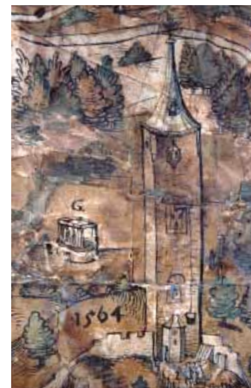
Alte Stadtansichten und Karten enthalten häufig Hinweise auf die ehemaligen Hochgerichte. Auf der Rottweiler Pürschgerichtskarte (Ausschnitt) von 1564 ist deutlich der vierschläfrige Galgen (G) der freien Reichsstadt zu sehen.

Das Aussehen der Richtstätten variiert sehr stark, wie vor allem die zahlreichen Darstellungen auf zeitgenössischen Bildern zeigen. Sie befanden sich meist in erhöhter Position, oft auf einem künstlich aufgeschütteten Hügel oder gemauerten Sockel. Dies bot den zahlreichen Schaulustigen die Möglichkeit, die Hinrichtung des Verurteilten besser verfolgen zu können. Auf diesen Hügeln stand der Galgen, der nach Anzahl der Pfeiler als zwei-, drei- oder