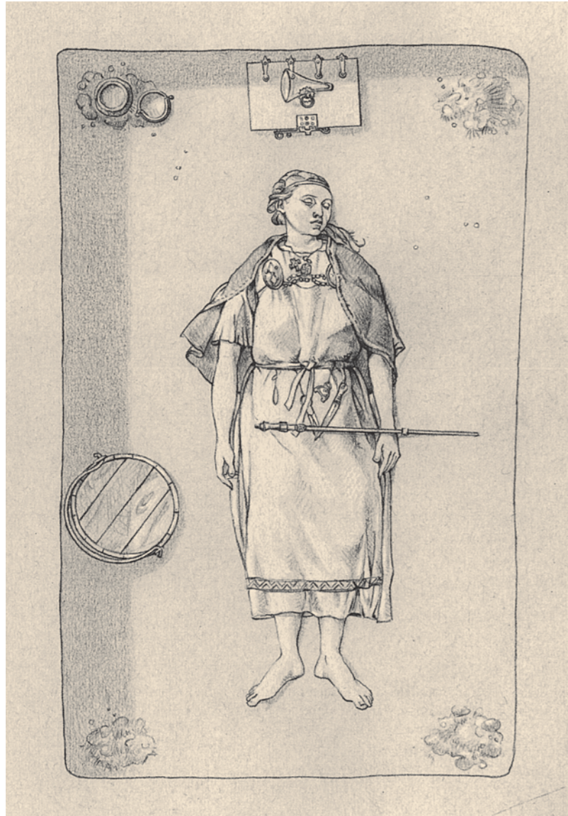
Hausfrau, Textilfachfrau, Gutachterin, Wahrsagerin oder Hure. Das Grab einer Wikingerin mit Eisenstab, Birka Gr. 660.